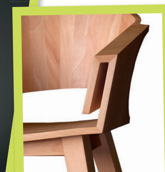
Bregje Vermaat, Studio lets, Stoel II, 2008, gestoomd beukenhout