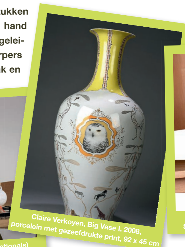
Claire Verkoyen, Big Vase I, 2008, porcelein met gezeefdrukte print, 92 x 45 cm